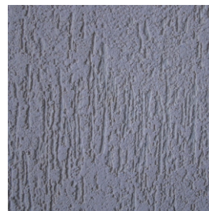
SERPO 436 RILLEN