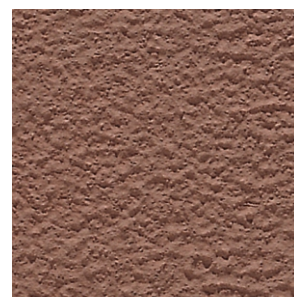
SERPO 435 SCRATCH