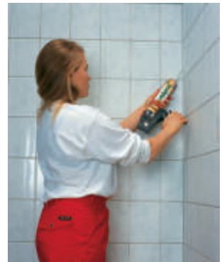
PAISUMISVUUGID VUUGITAKSE VETONIT SANITAARSILIKONIGA