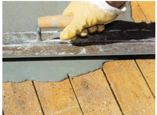
Remontsegu Vetonit 3300

Kruntaine MD16 lahjendatakse puhta veega ja harjatakse puhastatud aluspinnale kaks korda. Täpsem info vt. kruntaine MD16 tootelehte.