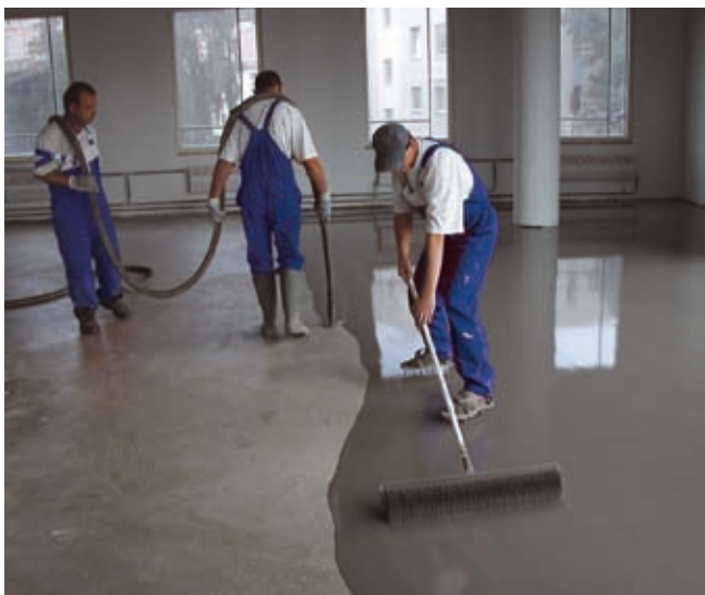
Isevalguv segu maxit Floor 4150 Fine Flow

Enne põrandatasandussegu kasutamist on veel üks oluline toode, mida ei tasu unustada – see on kruntaine MD16 . Tolm tuleb eemaldada kas harjaga või veel parem, tolmuimejaga.